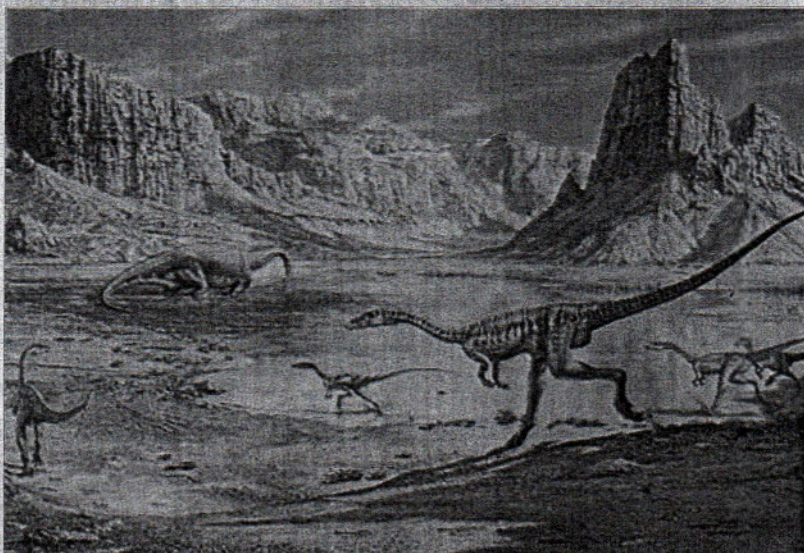
Las recreaciones ofrecen imágenes de absoluto realismo.