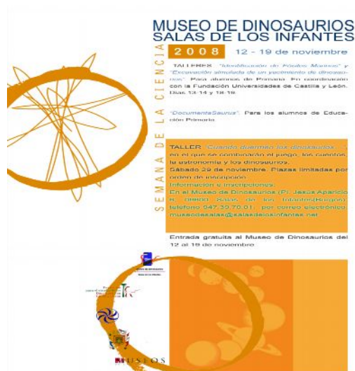
Cartel Semana de la Ciencia

Se realizaron asimismo talleres para alumnos de Educación Infantil y una actividad divulgativa sobre métodos de trabajo de los paleontólogos para alumnos de Educación Secundaria.