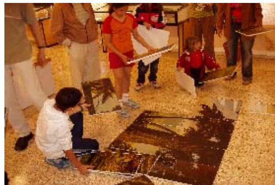
Taller de puzzles de fauna y flora