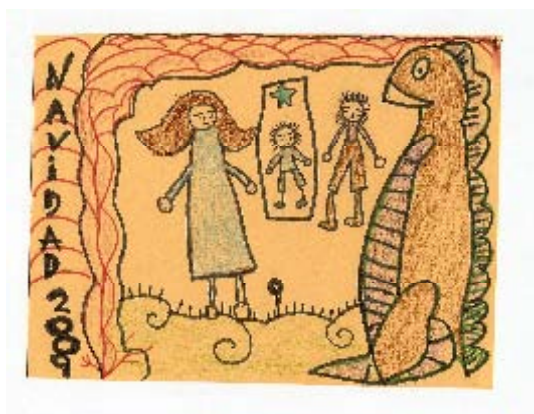
1º Premio Asunción de Prado Aspanias Burgos

Un año más la Fundación para el estudio de los dinosaurios en Castilla y León y la Fundación Aspanias Burgos convocaron el Concurso de Postales de Navidad, con el lema "La Navidad y los Dinosaurios". El certamen ha incrementado notablemente el número de tarjetas presentadas por personas con discapacidad intelectual, hasta alcanzar la cifra de 240, casi un 80% más de las presentadas en la edición anterior.