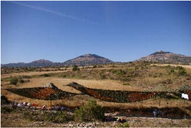
Las Sereas. Vista general con la Sierra de las Mambblas al fondo.