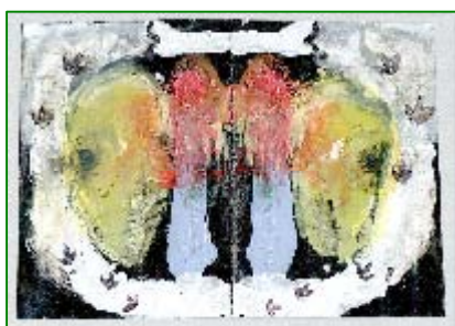
1º Premio Categoría A