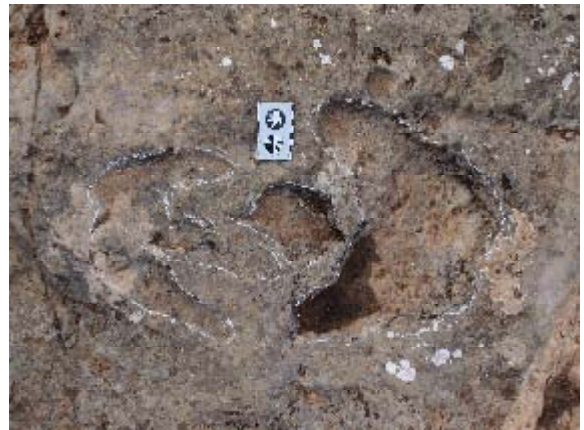
Huellas tridáctilas de Las Sereas