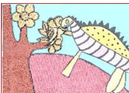
Accesit modalidad C