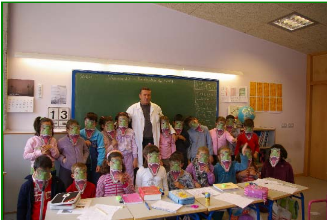
Taller de máscaras