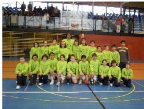
Equipo de baloncesto