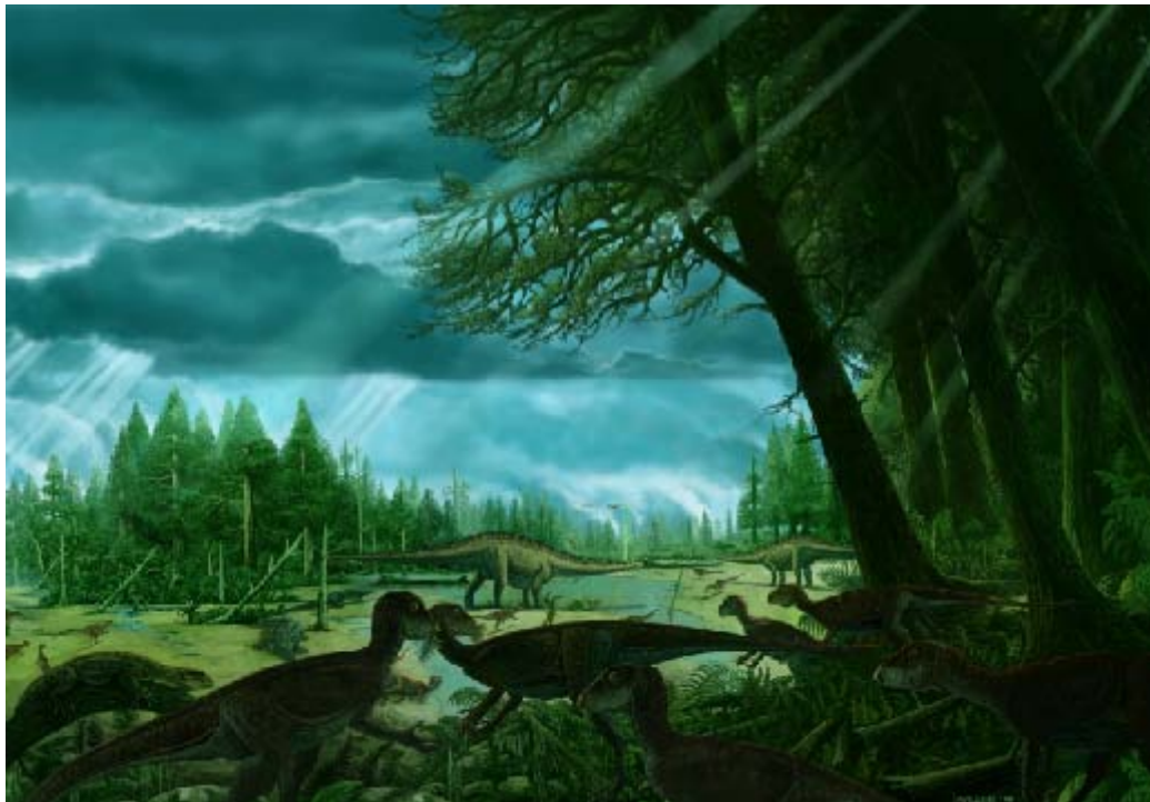
1º PREMIO: "Rebbaqiosairis e hypsoñphodontes en Burgos"

Los premios fueron de 500 € más diploma el primer premio, 350€ más diploma el segundo y 200 € más diploma el tercero.