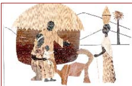
2º Premio Categoría B