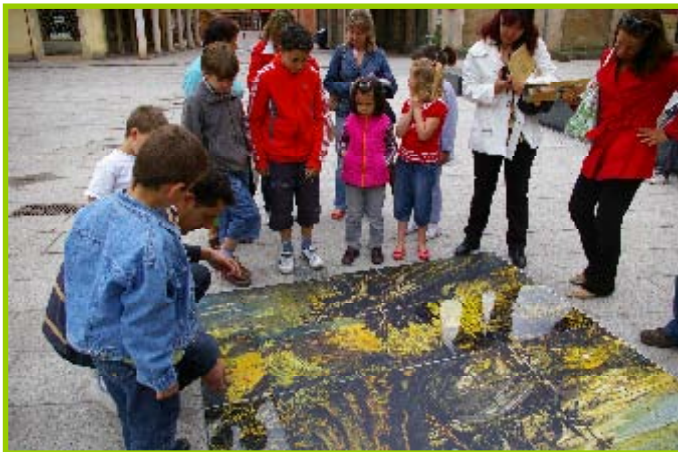
Puzzle gigante y excavación simulada en los Talleres de la Semana del Museo.