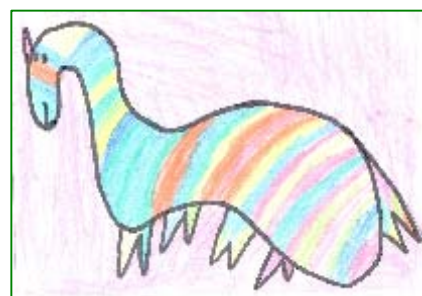
3º Premio Categoría C