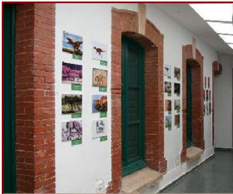
Exposición de ilustraciones científicas