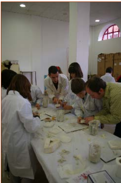
Taller de fósiles marinos