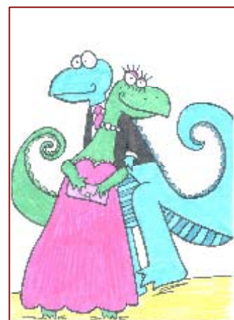
Accesit modalidad C