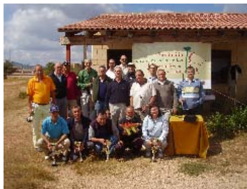
Torneo Golf Dinosaurios

La Fundación Dinosaurios sigue colaborando con la Escuela Municipal de Deporte, financiando equitaciones como la del equipo de Baloncesto con el lema "Salas deja huella" o con el campeonato de fútbol femenino de verano con el logo de la propia Fundación.