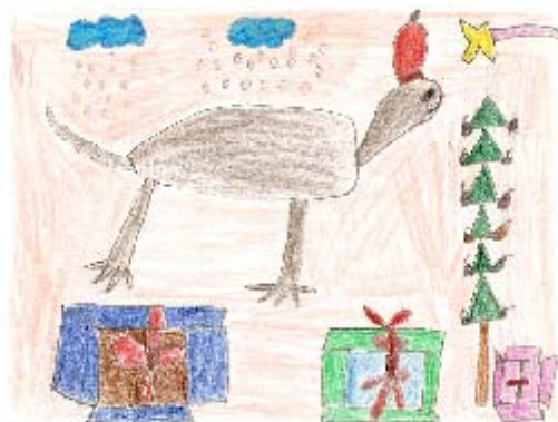
3º Premio Celeste Malmiera Asprodes Salamanca