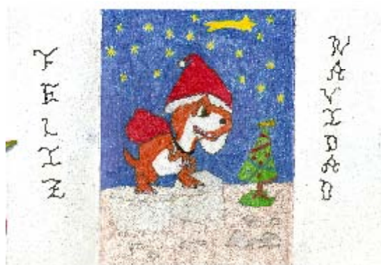
4º Premio José Ignacio Prieto Asprona Valladolid