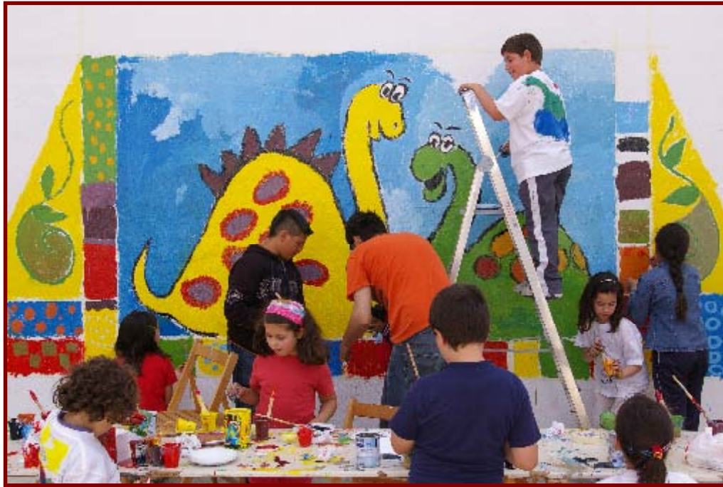
Mural de apoyo candidatura Patrimonio de la Humanidad