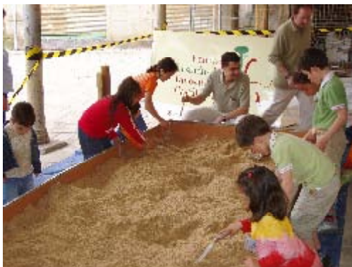
Taller de Campo: Excavación Simulada

Desde septiembre de 2007, se siguen ofertando los Talleres Didácticos sobre Paleontología de Dinosaurios, para todo tipo de centros educativos y asociaciones, ofreciendo una posibilidad didáctica y educativa para conocer la Historia de la Tierra y de la Vida, de una manera atractiva y lúdica la ciencia.