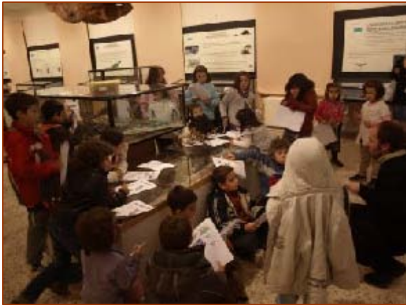
Taller de Darwin