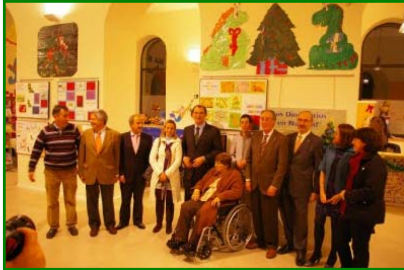
Patronos y miembros de ambas Fundaciones el día de la inauguración