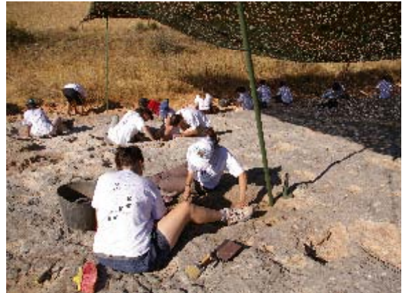
Trabajando en el yacimiento.