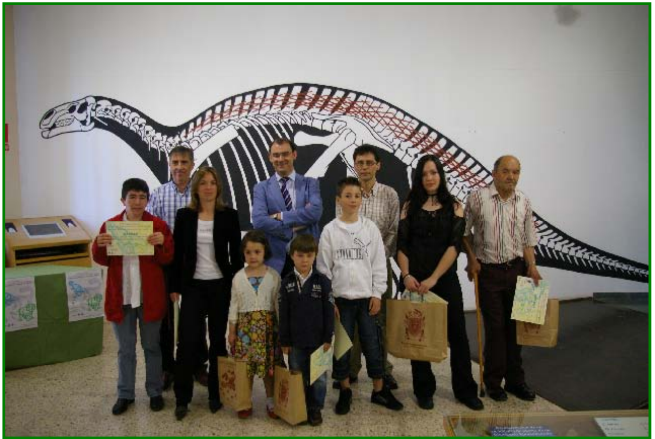
Ganadores V Concurso Postales de Dinosaurios