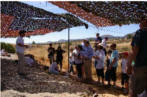
Explicación de Director de la excavación a Patronos y Colaboradores De nuestra Fundación