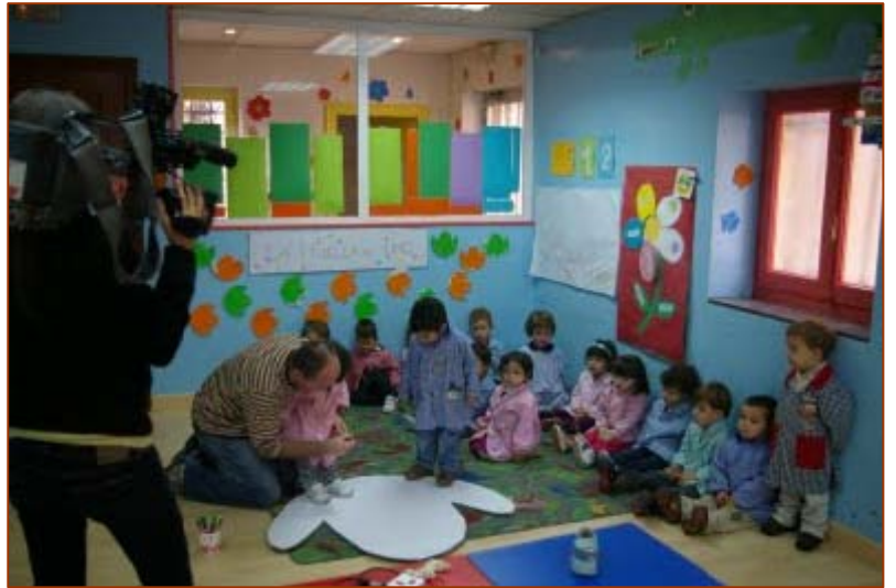
Nosotros también dejamos huella