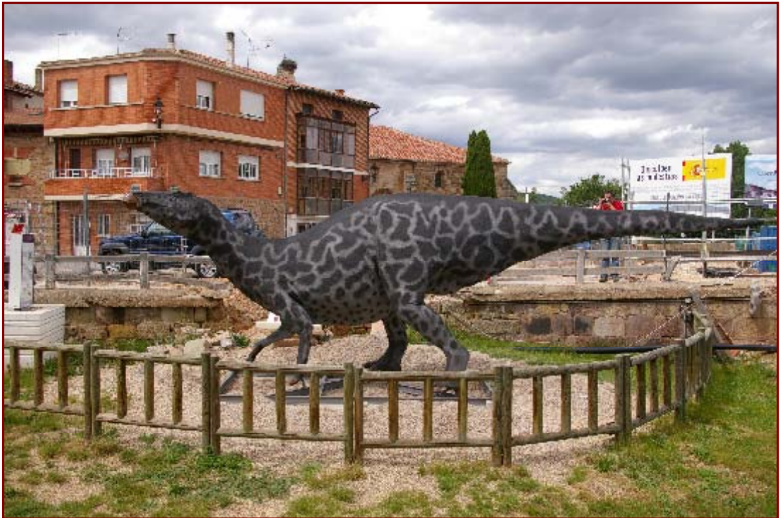
El iguanodon después de la reparación