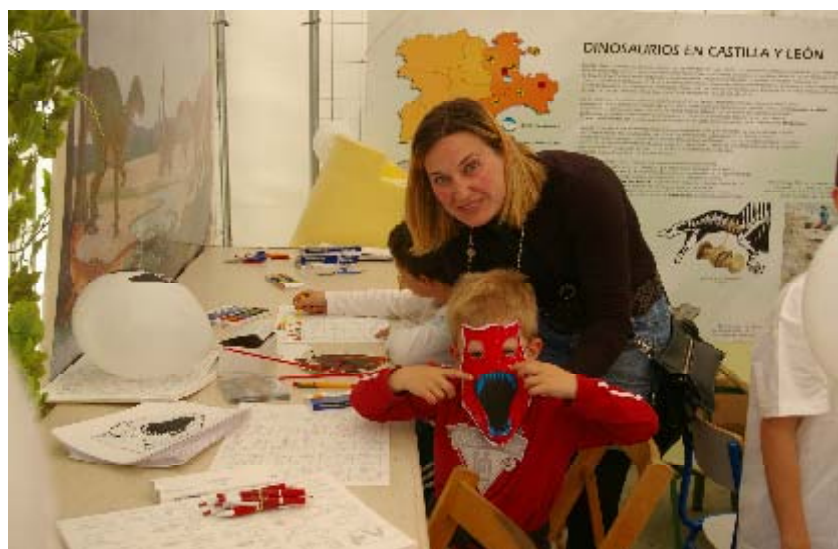
Taller de máscaras