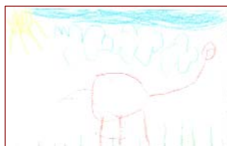
Accesit modalidad A