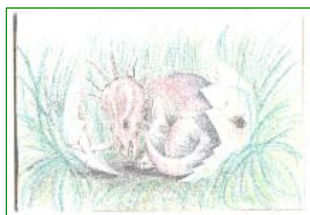
Accesit modalidad B