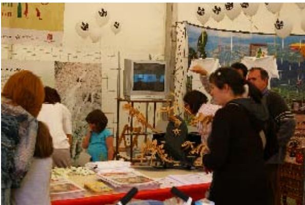
Stand de la Fundación en la Feria