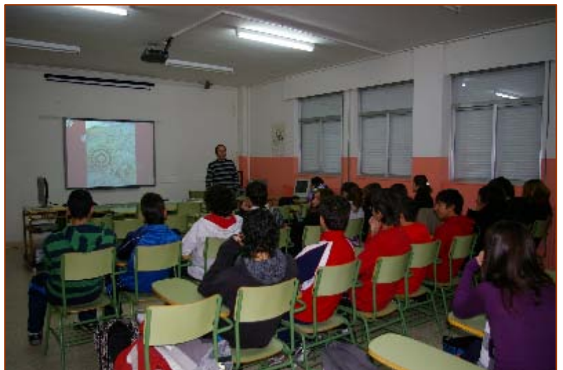
Conferencia en I.E.S. Alfoz de Lara